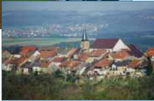
BERUS Gemeinde Überherrn commune d'Überherrn