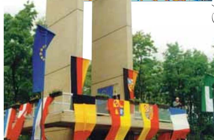
Städt. Kommunikation Saint-Avoir